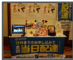
テルウェル東日本(株)様