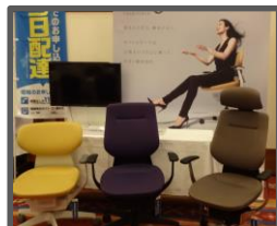
ココロ北海道販売(株)様