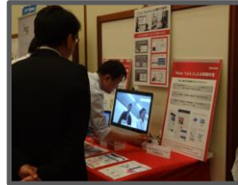
(株)NTTドコモ北海道支社様